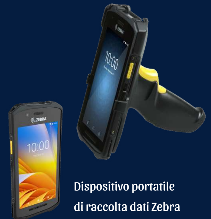
Dispositivo portatile di raccolta dati Zebra

L'app SYSCAN, se abbinata a un lettore di codici a barre/codici QR digitali, stabilisce una connessione di rete Internet TCP/IP con l'applicazione di gestione ERP Business Cube di NTS, consentendo uno scambio bidirezionale di dati operativi. Ciò include parametri operativi, come articoli, magazzini, listini, ubicazioni immagini e molto altro.