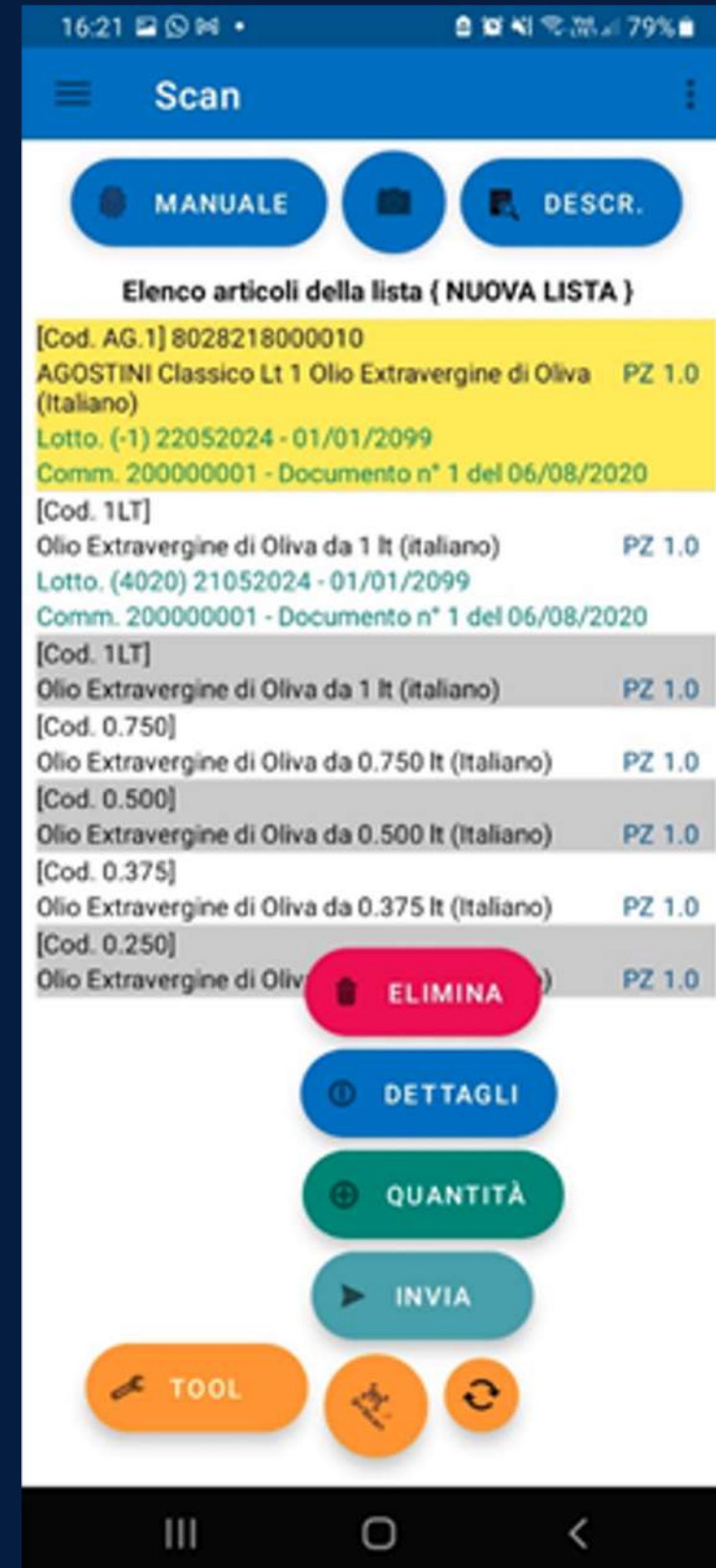
Elenco articoli scansionati