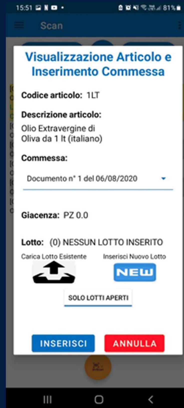
Possibilità di visualizzare i dati dell'articolo prima della conferma con gestione lotti e commesse